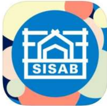
SISAB Skolkultur Utbildning