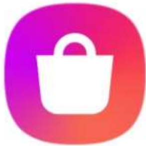
Samsung Galaxy Store