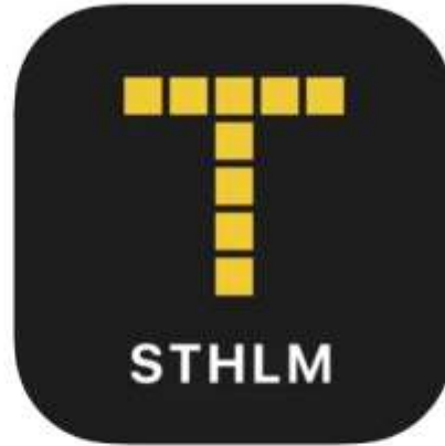
Trafiken.nu i Stockholm Resor