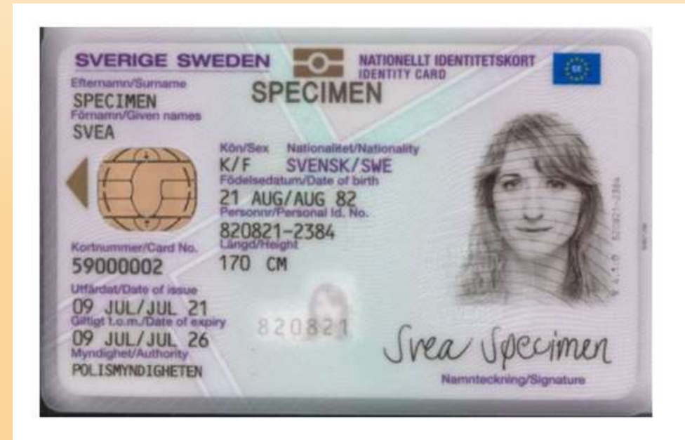
”Nytt” ID-kort sedan 2 augusti 2021