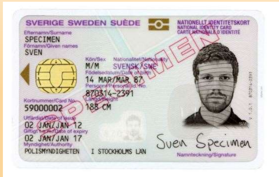
”Gammalt” ID- kort